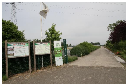
Sierteeltroute (lang – 46 km)