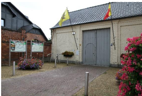
Sierteeltroute (kort – 31 km)

Dien de foto in via gentsebuitenband@landelijkegilden.be met vermelding van uw naam, adres en telefoon nummer. Bij verzending van de mail geeft u toestemming om de foto te gebruiken op sociale media.